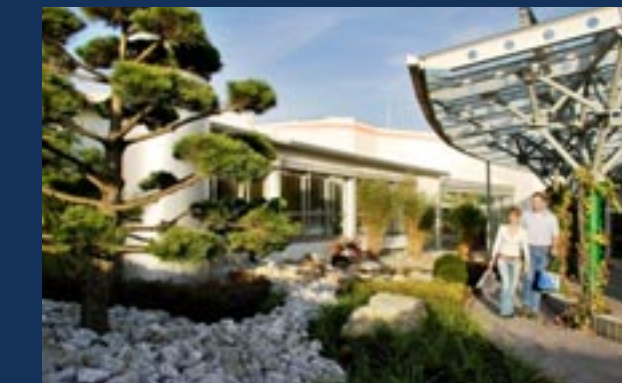
Eingang Vital Spa